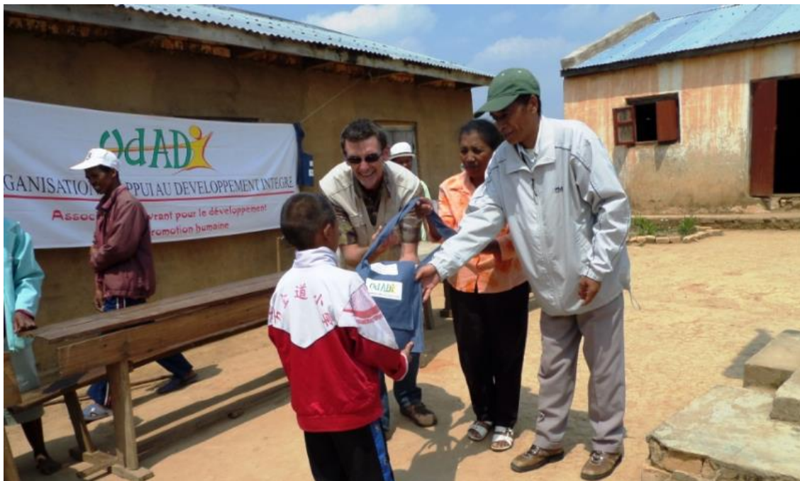
Distribution de kits scolaires à Madagascar avec notre partenaire Odadi

De plus en plus fréquemment, le désir de changer de vie professionnelle se fait ressentir. Que ce soit lié à une certaine lassitude dans son travail, un besoin d'évolution ou tout simplement un souhait de changer de carrière, la reconversion professionnelle se révèle parfois être une nécessité. Cette nécessité peut également être couplée à un souhait de se sentir « utile », de « donner du sens » à sa vie, à sa carrière. C'est dans cette optique que l'I.C.I propose un programme de reconversion professionnelle vers l'action humanitaire : découvrir la formation .